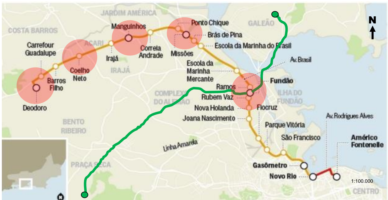
Figura nº 2 - Sistema de BRT da TransBrasil (conectado à Transcarioca)

Outro importante sistema de BRT que vem sendo implantado na cidade, a TransBrasil, conectado à Transcarioca (fig. nº 2), vem revelando, através de estudos e levantamentos de campo, um enorme potencial de redefinição do eixo rodoviário sobre o qual se instalará, a Avenida Brasil, com 58 km de extensão e marcada hoje por imensas áreas urbanas degradadas ou subutilizadas. O Sistema de BRT da Transbrasil vem como uma oportunidade histórica para a reestruturação de imensas áreas urbanas, sobretudo próximo aos seus equipamentos de interface, fazendo com que deixem de ser espaços somente de passagem, e se tornem espaços de trabalho, vivência, educação, inovação tecnológica, cultura e lazer.